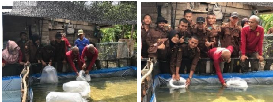
Gambar 3. Aklimatisasi benih

Hari ketiga pelaksanaan memasukkan benih yang berasal dari hatchery air tawar SUPM/Politeknik AUP Kampus Pariaman yang merupakan benih hasil TEFA taruna prodi teknologi akuakultur yang berjumlah 3000 ekor dengan ukuran 6-9 cm yang dipacking plastik dengan penambahan oksigen. Kantong plastik benih di apungkan pada permukaan kolam selama 30 menit untuk menyamakan suhu air dalam kantong plastik dengan suhu air kolam yang disebut aklimatisasi. Setelah itu kantong plastik dibuka dan dimiringkan, biarkan benih lele mutiara keluar dengan sendirinya.