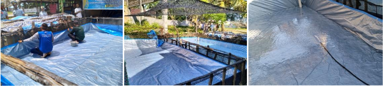
Gambar 2. Pemasangan Kolam Terpal dan Pengisian Air

Langkah-langkah umum untuk pemasangan kolam terpal yaitu lokasi pemasangan kolam terpal sudah datar dan bebas dari benda tajam, bersihkan area dari batu, ranting, atau material lain yang dapat merusak terpal. Bentuk rangka kolam dengan kayu sesuai ukuran yang telah ditentukan, rangkai dengan kuat. Setelah rangka kolam selesai kemudian bentangkan terpal dengan baik sesuai ukuran rangka kolam panjang dan lebar kolam. Letakkan terpal di atas rangka kolam dan terpal diletakkan dengan rata sehingga tidak ada lipatan yang berlebihan. Pada ujung atas terpal dilipat dan dirapikan kemudian pakukan pada ring kayu agar kuat dan mencegah terpal terangkat oleh angin atau gerakan air. Pasang pipa 2" dengan tinggi 65 cm pada salah satu sudut kolam yang berfungsi sebagai indikator kelimpahan air dan pembuangan air kolam. Tahap akhir lakukan pengisian air setinggi 60 cm dan biarkan mengendap selama 3 hari.