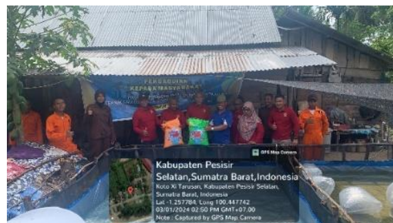
Gambar 4. Pemberian pakan awal

Selanjutnya pemberian materi mengenai pemberian pakan pada ikan lele, pakan ikan diberikan kepada masing-masing kelompok dengan jenis FP 500 dan PF 1000 dengan frekuensi 4 kali sehari sebanyak 3 % dari biomasa ikan.