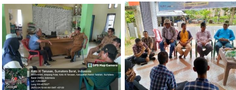
Gambar. 1 Sosialisasi dan Penjelasan Penelitian kepada Wali Nagari, Perangkat Nagari, dan Kelompok Budidaya

Sebagai bagian dari persiapan penelitian, dilakukan kegiatan sosialisasi dan penjelasan kepada Wali Nagari, perangkat nagari, dan kelompok budidaya. Kegiatan ini bertujuan untuk memberikan pemahaman mendalam mengenai tujuan, metode, dan manfaat penelitian, khususnya dalam mengevaluasi penerapan teknik pemasangan kolam terpal serta pemberian benih dan pakan pada kelompok masyarakat budidaya ikan.